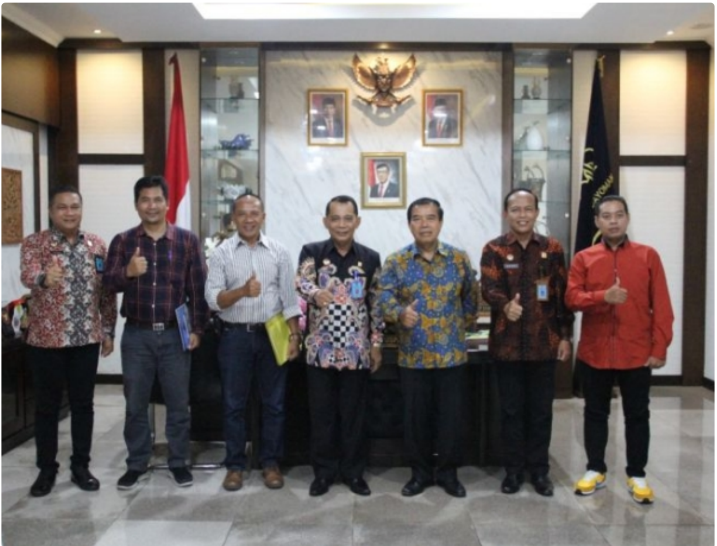
Kemenkumham Jateng - Unimus Jajaki Kerja Sama Bagi Perguruan Tinggi Muhammadiyah dan Aisyiyah

SEMARANG - Sinergitas dan kolaborasi antara Kantor Wilayah Kementerian Hukum dan HAM Jawa Tengah dengan Universitas Muhammadiyah Semarang (Unimus) semakin ditingkatkan.